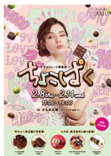
チョコレート博覧会 ちょこぱく