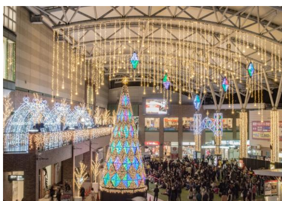
駅前イルミネーション ナガサキ☆テラス