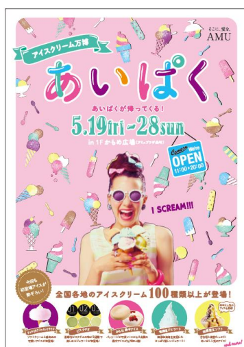
アイスクリーム万博 あいぱく