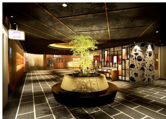
5階レストランフロア リニューアル