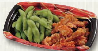
枝豆となんこつ唐揚げのセット 480円(税込518円)