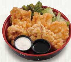
チキン南蛮 480円(税込518円)