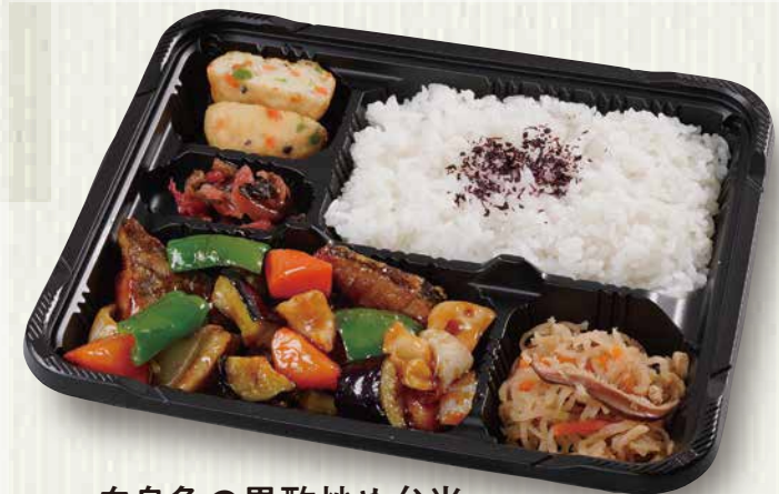
白身魚の黒酢炒め弁当