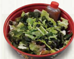
レタスとわかめのサラダ 250円(税込270円)