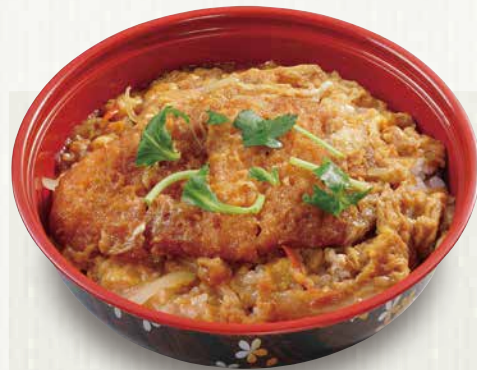
ローズかつ丼 680円(税込734円)