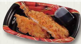
アジフライ 380円(税込410円)