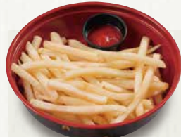
ポテトフライ 280円(税込302円)