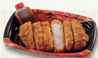
三元豚ロースかつ 680円(税込734円)