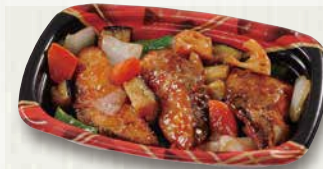
白身魚の黒酢炒め 480円(税込518円)