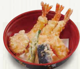
天ぷら盛り合わせ 430円(税込464円)