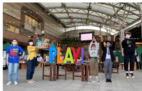
※前回開催の様子:長崎のクリエイターにスポットをあてたイベントを開催

アミュプラザ長崎は、「長崎の元気」を再発見・再発信することで長崎の皆さんを応援します!